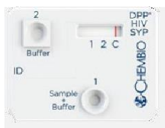
65-9525-0 DPP HIV-SYPHILIS