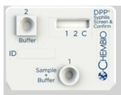
65-9520-0 DPP SYPHILIS SCREEN & CONFIRM